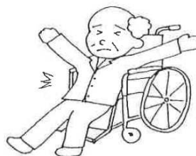
深く座りましょう！