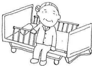
両足をしっかりと床につけて 立ちましょう！