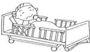
柵をあげましょう！