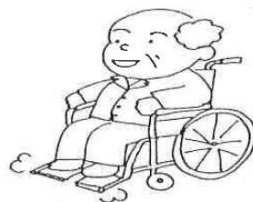
足台に足を乗せましょう！